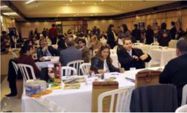
Una importante participación registra cada edición de la Expo Rueda, que se desarrolla a la par de la mayor expoferia del país, en Mariano Roque Alonso.